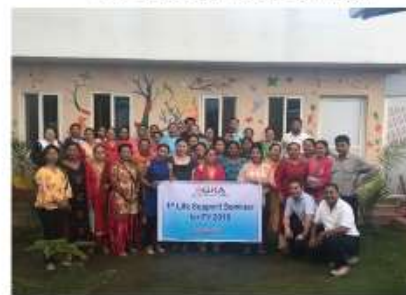
ラリットプール郡・84名/ Lalitpur ・84 in total