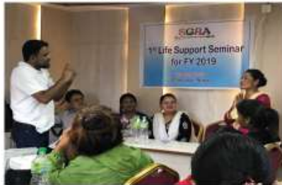
バクタプール郡・390名/ Bhaktapur ・390 in total

ライフサポートセミナーの開催・ネットワークメンバーの組織化 Organizing Life Support Seminar for providing useful information for net work members