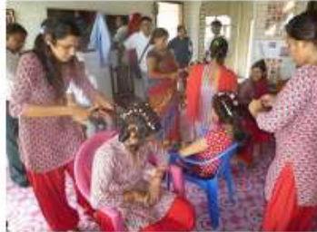
美容訓練(基礎・上級)/Beautician