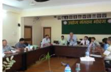
モラン郡作業委員/Morang RWC