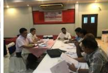
パルサ郡作業委員/Parsa RWC