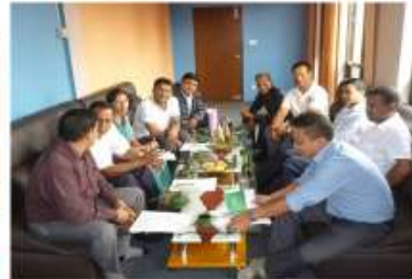
バクタプール郡作業委員/Bhaktapur RWC