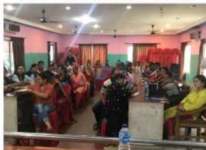
モラン郡・417名/ Morang ・417 in total