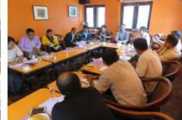
ラリットプール郡作業委員/Lalitpur RWC