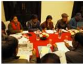
拡大中央委員会 Central Advisory Committee