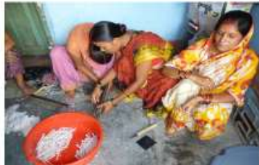
付加価値キャンドル/Candle making