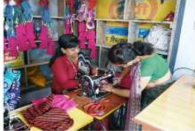
縫製訓練(基礎・上級)/Sewing

Providing vocational trainings and literacy education to raise of living standards