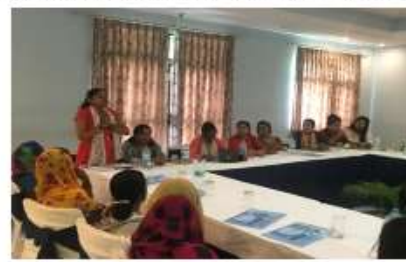
パルサ郡・384名/ Parsa ・384 in total