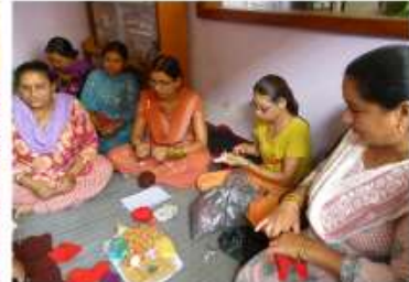
ニットイング訓練/Knitting